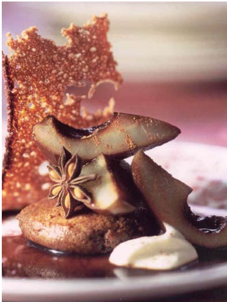
(© Tony Le Duc, uit 'Outdoor Cooking' van Felix Alen)